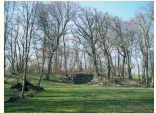
Verfallende Grotte.

Seit das Land 1986 das Gut übernahm unterblieben fachgerechte Pflegearbeiten im öffentlich zugänglichen Park, so fielen Altbäume um, die weder entfernt noch ersetzt wurden, ganze Partien im Randbereich verwilderten und die Wartungsarbeiten an den Drainagen unterblieben, so dass es zu monatlang andauernden großflächigen Vernässungen auf den Wiesen